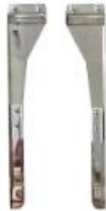
GUIA IZQUIERDA Y DERECHA DE BORDADO