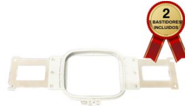
BASTIDOR DE 10X10 CM

La máquina de bordar trae 2 Bastidores planos redondos de medidas 6X4cm, ideal para realizar bordados en logos pequeños, para el área de las mangas de las prendas, o para bordar los laterales o posterior de las gorras ya armadas.