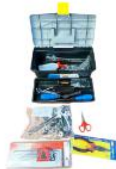
KIT DE HERRAMIENTAS