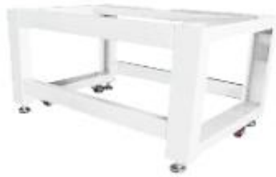
MESA DE BASE