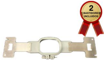
BASTIDOR DE 6X4 CM