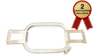
BASTIDOR DE 18X13 CM

La máquina de bordar trae 2 Bastidores planos redondos de medidas 10x10cm, ideal para realizar bordados en logos medianos, para el área del bolsillo de las chemises, franelas, camisas, sweeters, polos, buzos, etc.