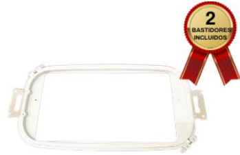
BASTIDOR DE 30X20 CM