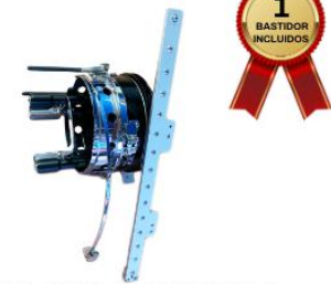
GUIA PARA GORRAS

La máquina de bordar trae 2 aros para gorras, estos aros son los que permiten entamborar la gorra armadas y fijarlas a la base guia en la máquina de bordar.