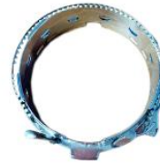
AROS PARA GORRAS

La máquina de bordar trae 1 estación para gorras, esta estación se utiliza para poder entamborar las gorras ya armadas con el aro del bastidor y poder prepararla lo más comodo posible.