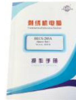
MANUAL DE USUARIO