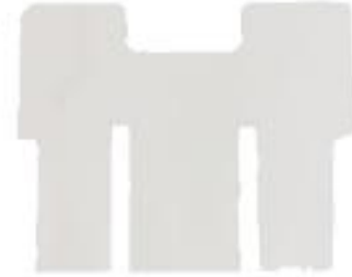
TABLA PLANA PARA EL BORDADO