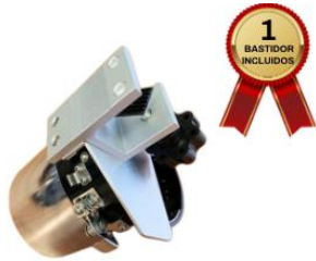
ESTACION PARA GORRAS