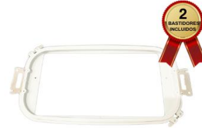
BASTIDOR DE 36X20 CM

La máquina de bordar trae 2 Bastidores planos redondos de medidas 30x20cm, ideal para realizar bordados en logos grandes, para el área de la espalda de las chemises, franelas, camisas, sweetters, polos, buzos, etc.